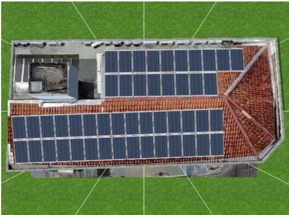
Figura 5 FATESE - FACULDADE DE TECNOLOGIA SENAC