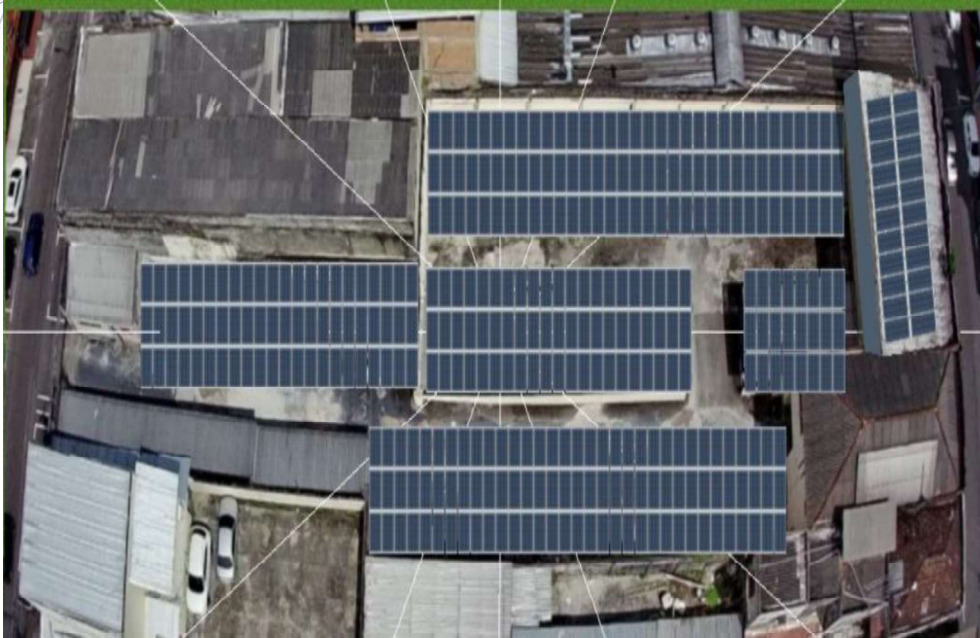
Figura 6 FATESE - ESTACIONAMENTO FACULDADE DE TECNOLOGIA SENAC