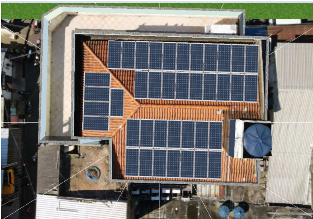
Figura 13 CEP PROFESSOR JÉFERSON PÉRES