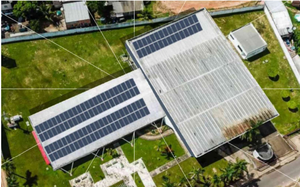
Figura 12 CEP LILI BENCHIMOL