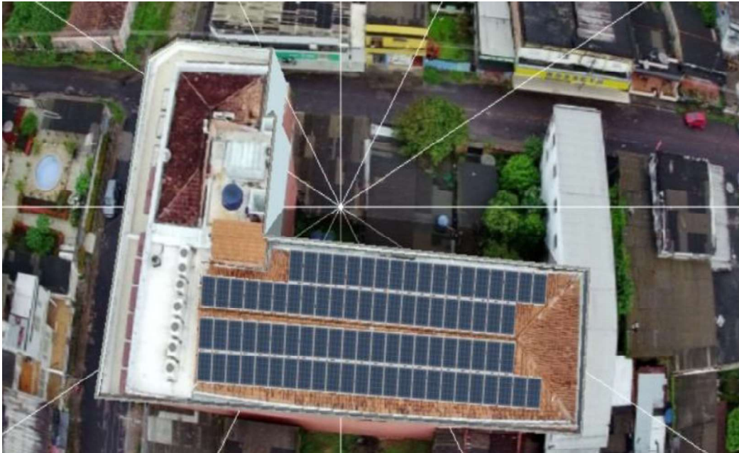
Figura 10 CEP MOYSÉS BENARRÓS ISRAEL