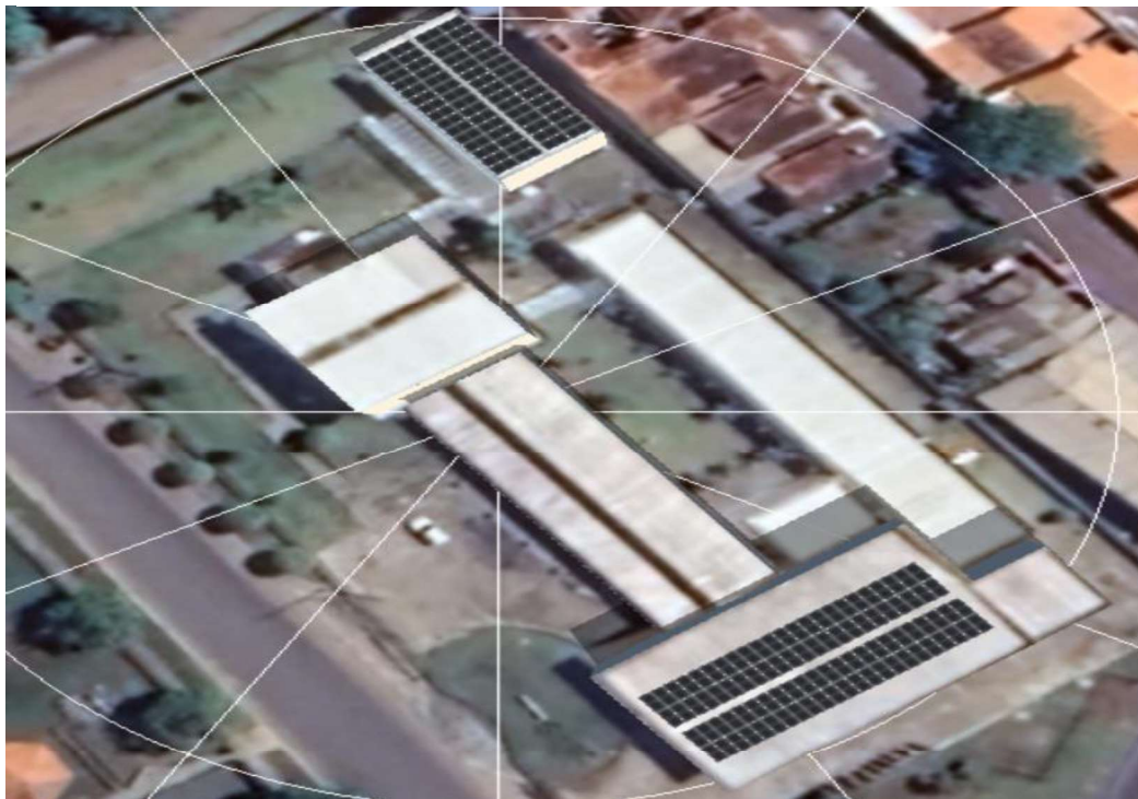
Figura 11 CEP MATHES PENNA RIBEIRO