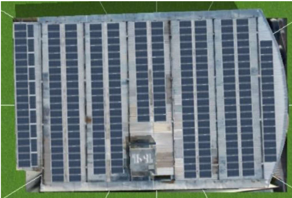
Figura 7 CENTRO ESPECIALIZADO DE INFORMÁTICA